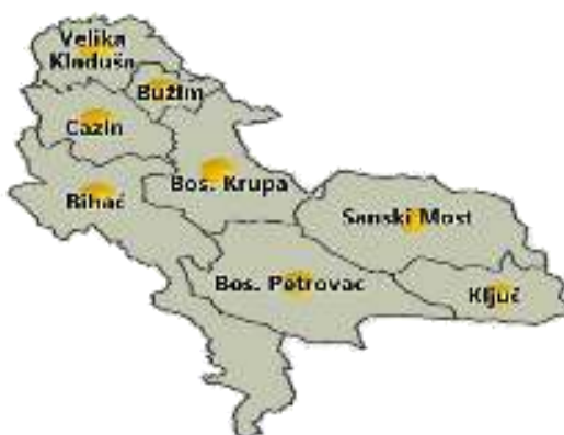
Slika 1: Položaj općine Ključ u USK

Općinu sačinjava 41 naseljeno mjesto, a centar Općine je grad Ključ. Općina je stacionirana na važnom putnom pravcu M-5 Bihać – Sarajevo. Ovaj putni pravac je povezan sa Zapadnom Evropom preko Karlovca i Rijeke (Hrvatska). Udaljenost općine Ključ u odnosu na veće gradove u okruženju je: